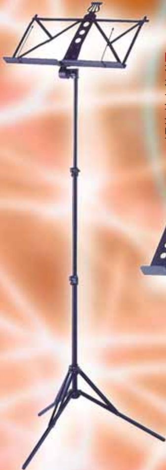
YP 301 AL